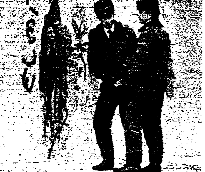
حوار بين بولينا وبين جنسين. شرفين. وواطن. غربي.

اعرب مصدر قريب من منظمة حلف شمال الاطلسي امس عن اعتقاده بان الاقتراح الذي عرضه رئيس الفريق السوفياتي الاتلي الشرفي غريغور غيسي والداعي الى خفض القوات المسلحة التابعة لدولتي المانيا الى النصف في غضون عامين وسيبحث في اطار اتفاقية خفض الاسلحة التقليدية التي ينتظر ان توقع هذا العام في فيينا.